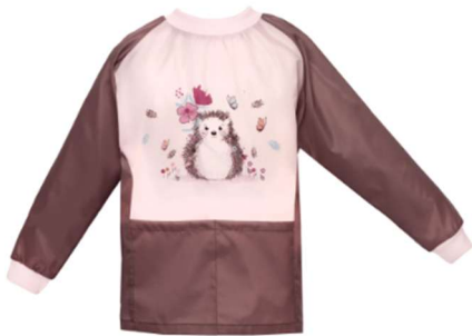
Tablier à manches longues pour le bricolage