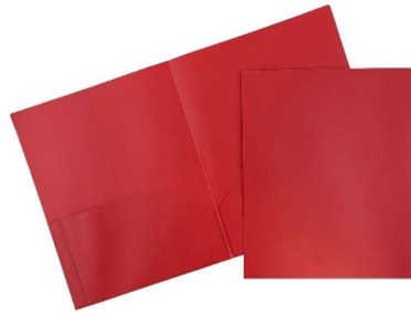
Chemise à pochettes plastique rouge sans les attaches