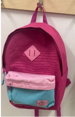
Sac à dos