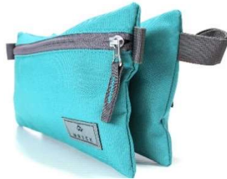
Étui à crayons double