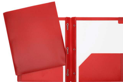
Duo-tang avec 2 pochettes intérieures