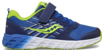
Espadrille pour la classe et le gymnase