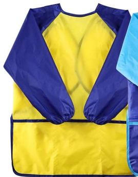
Un tablier à manches longues