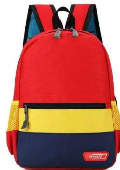
Sac à dos