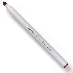
Crayons feutres à pointe moyenne