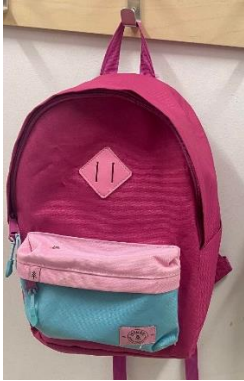
Sac à dos