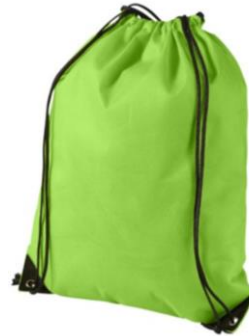
Sac d'éducation physique