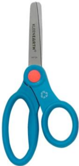
Ciseau avec poignée pour le pouce différente des autres doigts