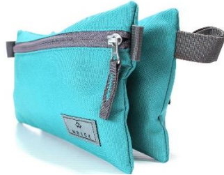
Étui à crayons double