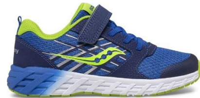
Espadrille pour la classe et le gymnase