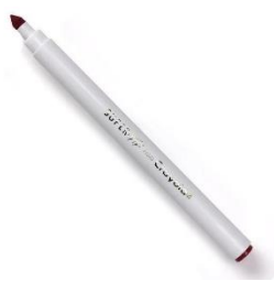
Crayons feutres à pointe moyenne