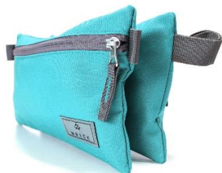
Étui à crayons double