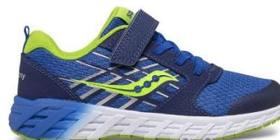
Espadrille pour la classe et le gymnase