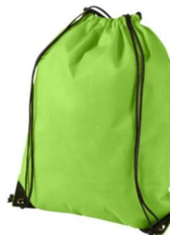
Sac d'éducation physique